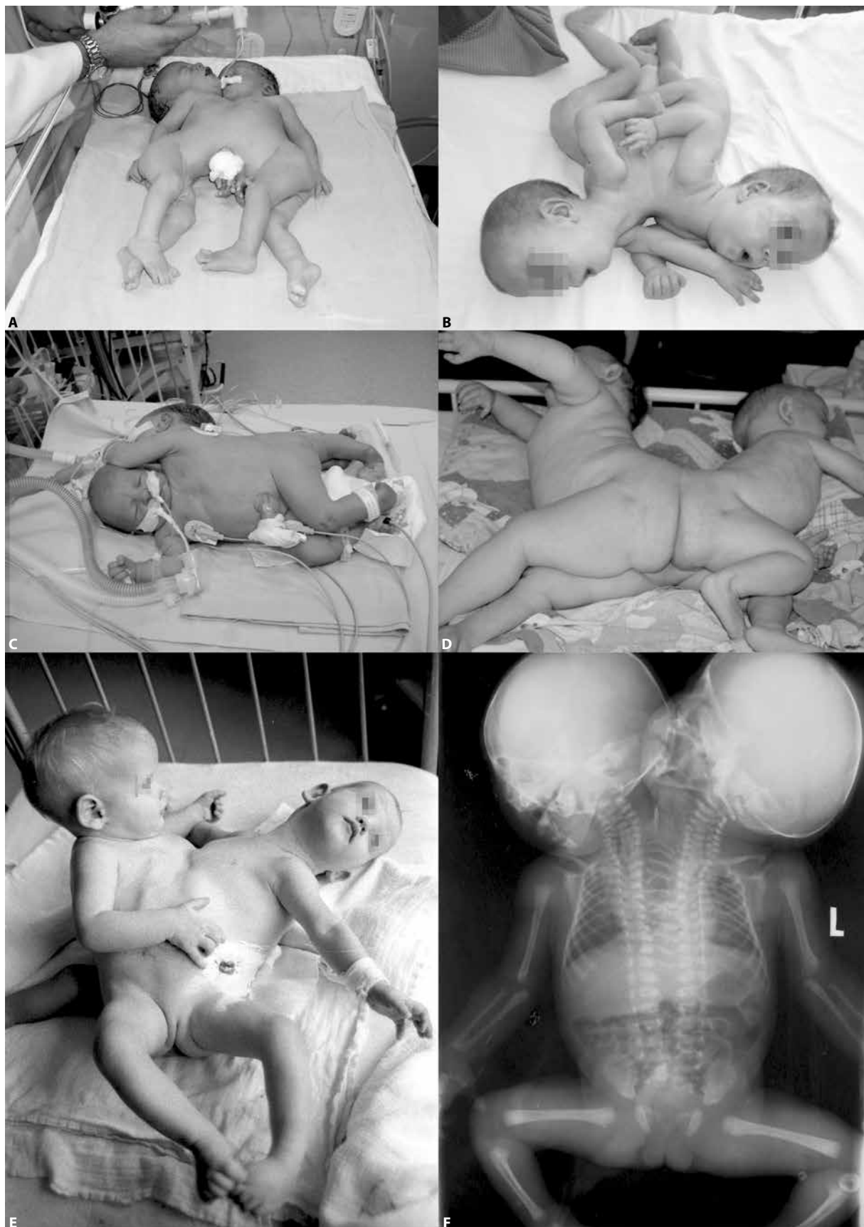
Rycina 1. Różne postaci zrosłaków symetrycznych. A — thoraco-omphalo-pagus po porodzie; B — kilkutygodniowe zrosłaki thoraco-omphalo-pagus ; C — thoracopagus ze wspólnym sercem; D — pygopagus ; E — xiphoomphalo pagus ; F — dicephalus dipus dibrachius RTG